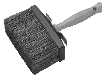
Brosses en soie de Chine grise, réf 664