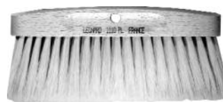
Brosses pour patine 1110 PL

Il est très utile, voire indispensable d'avoir sous la main les accessoires suivants :